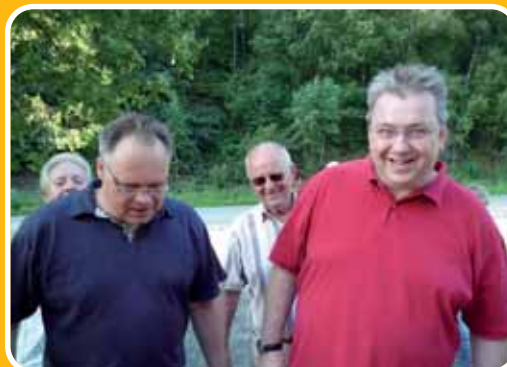
Zustieg Bahnhof Ehringhausen