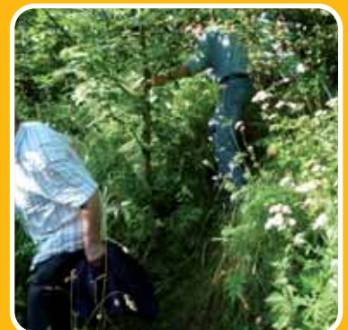
Bahnhof Siepen unzugänglich