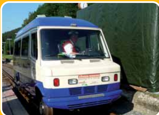
Abfahrt Bahnhof Oberbrügge

Fahrt mit dem Schienentaxi zum Bogenschießen in den Siepen